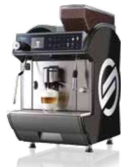
Idea Restyle Cappuccino