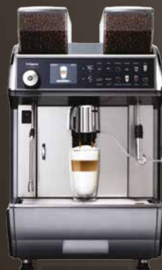
Idea Restyle Duo