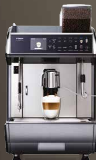
Idea Restyle Power Steam