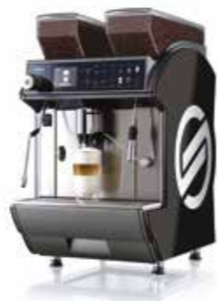
Idea Restyle Duo