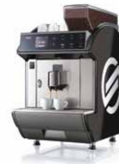
Idea Restyle Coffee