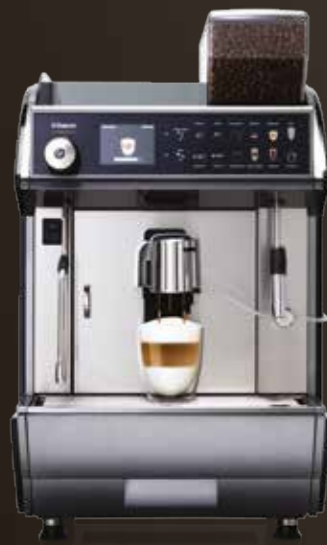
Idea Restyle Cappuccino