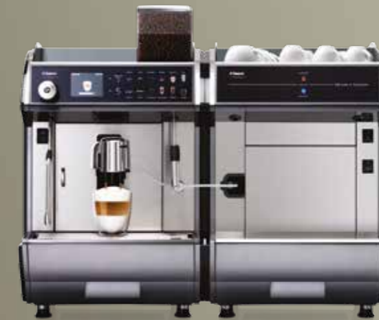
Idea Restyle Cappuccino + Idea Restyle Milk