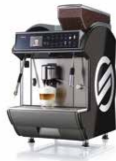
Idea Restyle Power Steam