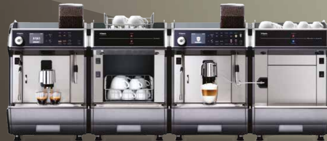
Idea Restyle Luxe + Idea Restyle Cups + Idea Restyle Cappuccino + Idea Restyle Milk