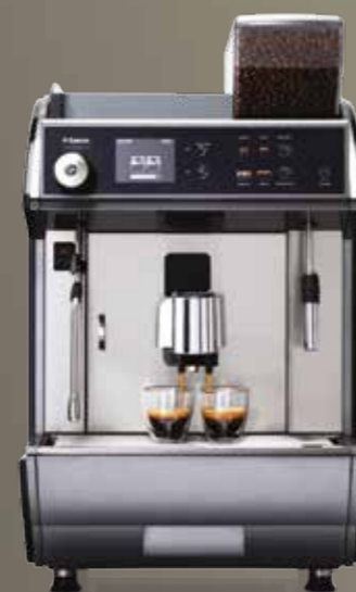
Idea Restyle Luxe