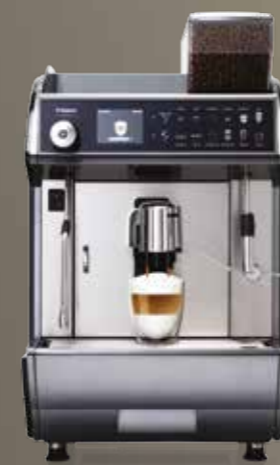
Idea Restyle Cappuccino