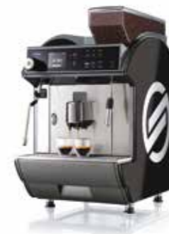
Idea Restyle Luxe