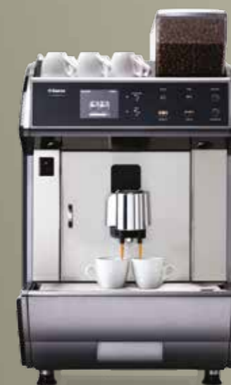
Idea Restyle Coffee